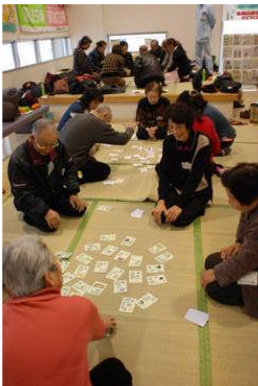
口福かるた 盛り上がりました