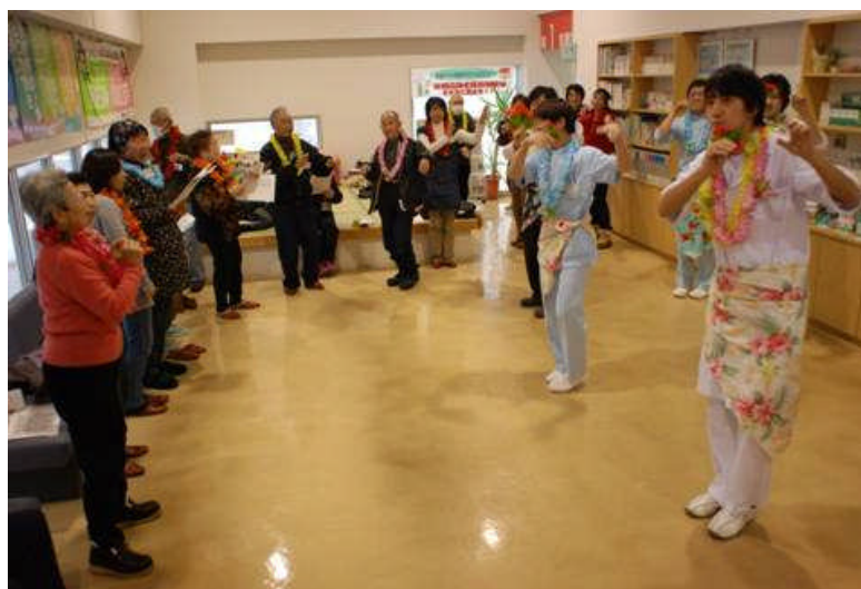
カメカメ歯フラダンス 男子ダンサー盛り上げました