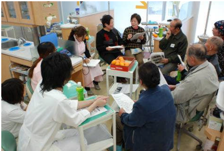
座談会では、来年度の歯科行事での協力について検討しました