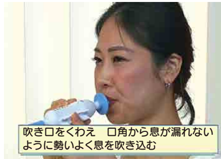
吹き口をくわえ 口角から息が漏れないように勢いよく息を吹き込む