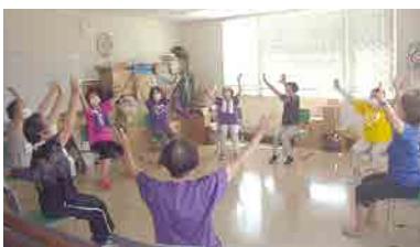
生協本部「にぎわい」笑いヨガで健康維持