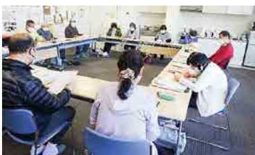
生協みなかみ歯科「つきよの虹ホール」会議・運動はもちろん調理ができる設備も整っています。