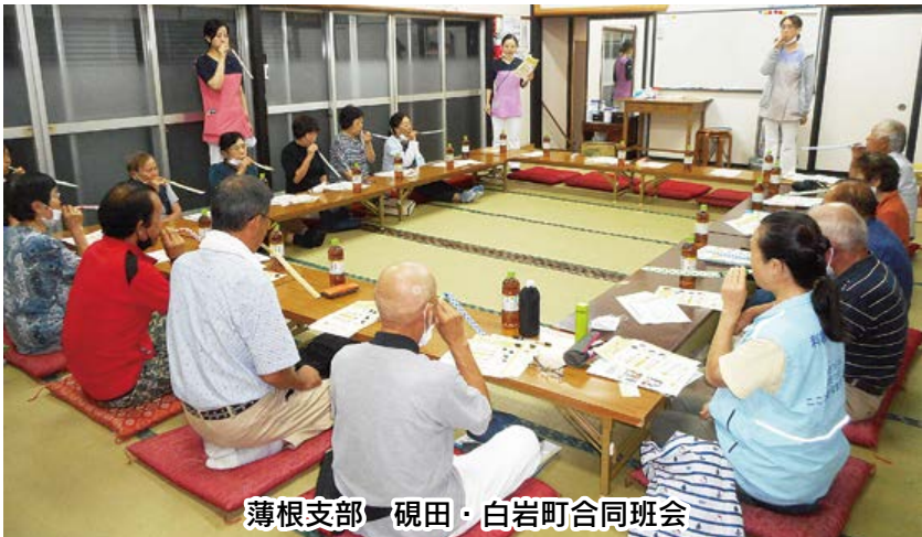
薄根支部 硯田・白岩町合同班会

生協に加入する ときの出資金 皆さまからお預かりしている出資金は、利根保健生協の事業を行うための資本金の一部です。出資金は寄付ではなく、世帯主だけでなく、生協組合員として個人加入し、事業所を利用していただく。また増資への協力もお願いします。 組合員になって利用 組合員になるには「加入申込書」に出資金を添えて、病院、診療所、生協本部総務部へお申し込み下さい。出資金は一口1,000円から加入できますが、加入時は5口からおすすめていきます。組合員(本人)になることで各事業所への通院支援が受けられます。また、有償ボランティア制度による組合員どうしの助け合いが利用できます。協力者も募集中です。 健康や暮らしに役立つ機会「利根の保健」が届きます。さらに、自由診療費で組合員価格制度があります。 (資料1) 加入対象地域は、定款でまわっています。沼田市、利根郡、吾妻郡一円、旧赤 地域まるごと 健康づくり 毎年、ぐんままるごと健康チャレンジへの参加をおすすめしています。まちかど健康チェックは温泉やスノーパールの場所をお借りして開催されています。その他地域のお祭りや文化祭などでも行っています。 また、医療者による学校での保健講話や手洗い教室など多彩な活動を行っています。 利用委員会では 組合員の代表が各事業所の利用委員会へ参加し、運営に関する事項について意見交換が定期的に行われています。 自主的な活動 生協では3人以上の仲間が集まり「班」をつくって、組合員が主体の「健康班会」を開催しています。ご近所さんやお友達、お知り合い同