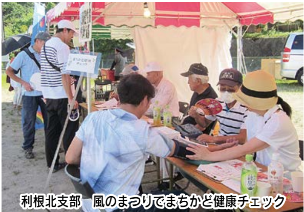
利根北支部 風のまつりでまちかど健康チェック

生協に加入する ときの出資金 皆さまからお預かりしている出資金は、利根保健生協の事業を行うための資本金の一部です。出資金は寄付ではなく、世帯主だけでなく、生協組合員として個人加入し、事業所を利用していただく。また増資への協力もお願いします。 組合員になって利用 組合員になるには「加入申込書」に出資金を添えて、病院、診療所、生協本部総務部へお申し込み下さい。出資金は一口1,000円から加入できますが、加入時は5口からおすすめていきます。組合員(本人)になることで各事業所への通院支援が受けられます。また、有償ボランティア制度による組合員どうしの助け合いが利用できます。協力者も募集中です。 健康や暮らしに役立つ機会「利根の保健」が届きます。さらに、自由診療費で組合員価格制度があります。 (資料1) 加入対象地域は、定款でまわっています。沼田市、利根郡、吾妻郡一円、旧赤 地域まるごと 健康づくり 毎年、ぐんままるごと健康チャレンジへの参加をおすすめしています。まちかど健康チェックは温泉やスノーパールの場所をお借りして開催されています。その他地域のお祭りや文化祭などでも行っています。 また、医療者による学校での保健講話や手洗い教室など多彩な活動を行っています。 利用委員会では 組合員の代表が各事業所の利用委員会へ参加し、運営に関する事項について意見交換が定期的に行われています。 自主的な活動 生協では3人以上の仲間が集まり「班」をつくって、組合員が主体の「健康班会」を開催しています。ご近所さんやお友達、お知り合い同