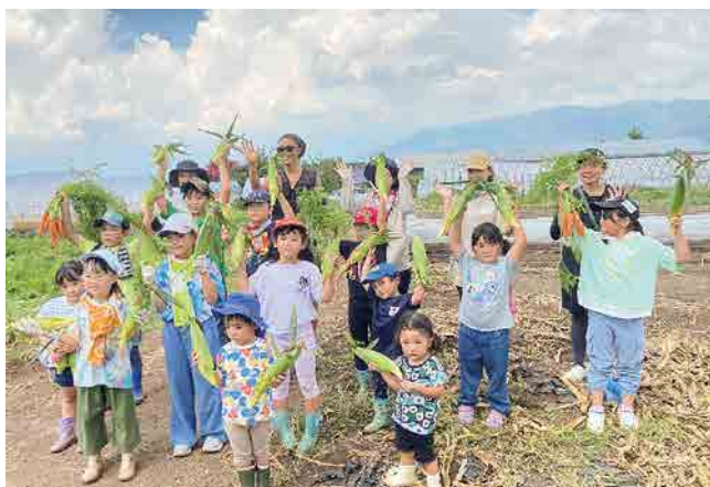
「たくさんとれたよ!」

で見ると違うね」「山車を見るのも久しぶりだよ」と入居者の皆様も喜んでおられました。入居者様の中には、その日のことがとても印象強かつたらしく、9月になった今でも「ここに太鼓が来て、叩いたんだよ」と教えてくれます。印象深いものはしっかりと記憶に残ることを改めて学びました。今後もケアに活かしていきたいと思えます。