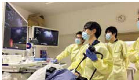
EUS を用いた検査の様子

きない、消化管粘膜下の病変や膵臓・胆道病変の組織診断、リンパ節腫大の原因診断などに有用です。現在は、手術や化学療法（抗癌剤）の前に病理組織をとることが一般的になってきており、個々の組織所見に応じたオーダーメイド医療なども普及しつつあり、この検査は非常に重要なものとなってきています。