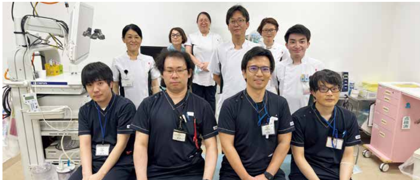
内視鏡室スタッフ

今までは、利根沼田地域にはこの装置がなく、検査が必要な場合には渋川・前橋方面の病院に紹介しなければなりませんでした。今年度より当院で行えるようになり、膵臓癌などの早期診断も速やかに行える体制が整いました。引き続き、スタッフが丸となって消化器内科診療に取り組んでいきますのでどうぞよろしくお願いいたします。