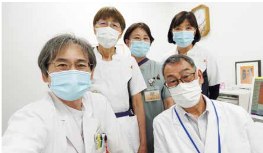
精神科スタッフ一同：ベテラン揃いです