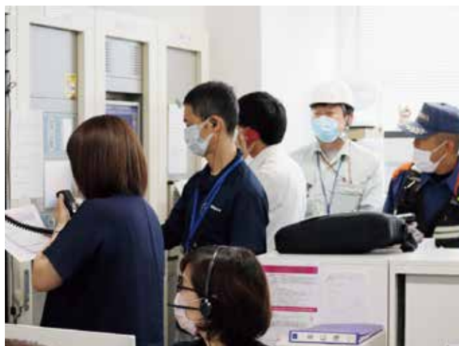
自衛消防本部の様子

当日は利根沼田広域消防本部の職員が見守る中、午後1時に出火した想定で訓練が開始されました。火災断定の後、自衛消防本部が総務課内に設置され、避難誘導班、初期消火班、通信連絡班と各任務遂行にあたりました。今回の反省点を総括し、次回の訓練に活かしていきたいと思います。日頃の訓練の重要性を再認識した1日となりました。