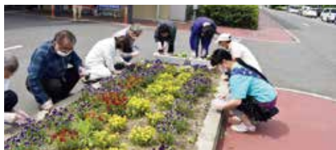
デイケア通所の皆さんと花壇のお手入れ

「病気を治す」ことだけでなく、患者の「生きる」ことへの支援や「こころの健康社会」の実現に向けて、スタッフ一同、今後も頑張っていきたいと思っておりますので、どうぞよろしくお願い申し上げます。